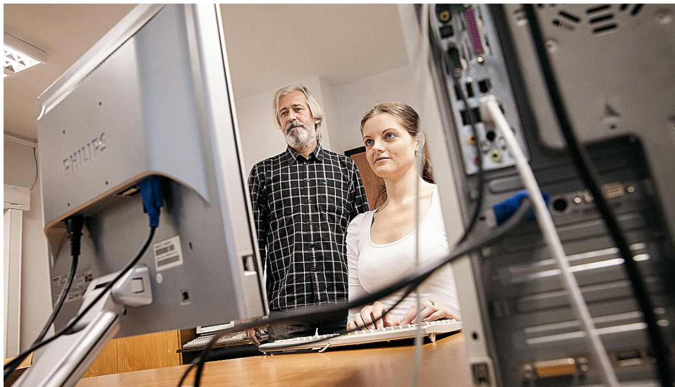
Potrebuje veľmi dobrých študentov, ktorých budú učiť veľmi dobrí učitelia, potom budeme veľmi dobrou školou a môžeme získať aj tie najlepšie granty.