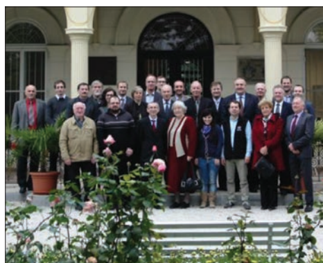
Účastníci odborného seminára pred Učebno-výcvikovým zariadením SvF v Kočovciach pri príležitosti 75. výročia založenia Ústavu betónového staviteľstva Slovenskej vysokej školy technickej v Bratislave

História Katedry betónových konštrukcií a mostov Stavebnej fakulty STU v Bratislave sa začala písať v roku 1938. V školskom roku 1938/39 bolo na Slovenskej vysokej škole technickej (SVŠT) zriadené študijné oddelenie Inžinierskeho staviteľstva konštruktívneho a dopravného. Predchodcami katedry v jej súčasnej podobe boli tri ústa-