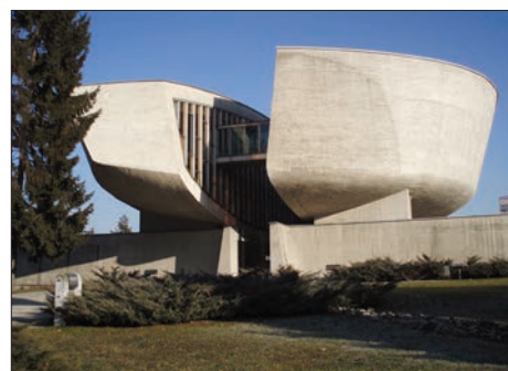
Pamätník SNP v Banskej Bystrici (1969)

Viacerí pracovníci katedry v akademických funkciách prispeli svojimi skúsenosťami nielen k rozvoju katedry, ale aj fakulty