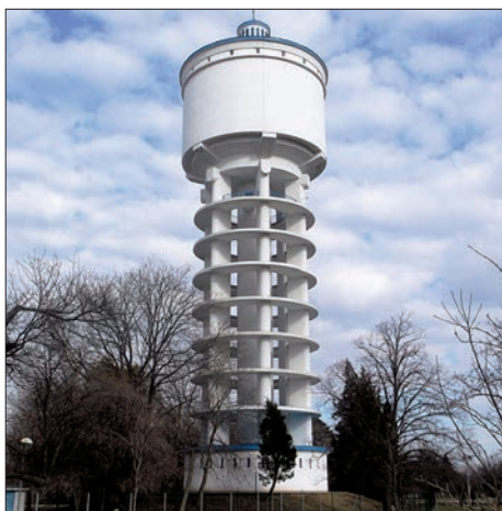
Vodojem v Trnave (1954) založený na betónovej škrupine

Členovia katedry majú veľmi dobré a úzke kontakty aj so stavebnou praxou, ktoré rozvíjajú aplikáciou výsledkov teoretického a experimentálneho výskumu.