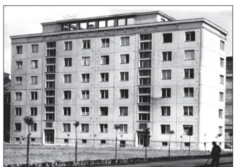
Prvá panelová budova (1956) bola postavená v Bratislave

História Katedry betónových konštrukcií a mostov Stavebnej fakulty STU v Bratislave sa začala písať v roku 1938. V školskom roku 1938/39 bolo na Slovenskej vysokej škole technickej (SVŠT) zriadené študijné oddelenie Inžinierskeho staviteľstva konštruktívneho a dopravného. Predchodcami katedry v jej súčasnej podobe boli tri ústa-