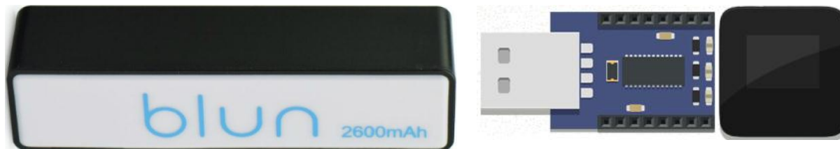
Obr. 3: Externá batéria Blun (vľavo), USB modul (v strede) a Microview (vpravo) [7].

Mart'anské hodinky Arduino však neboli dostatočne malé na to, aby sa pohodlne nosili. Na vytvorenie vreckových mart'anských hodiniek bol použitý mikropočítač Microview (rozmery 25,4 x 25,4 mm) s USB modulom (25,4 x 35,5 mm), Obr. 3.